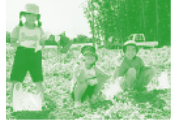
おいしいなバレイショが収穫できたよ