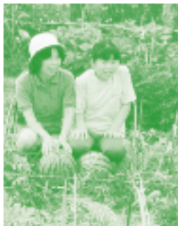
大玉スイカの収穫