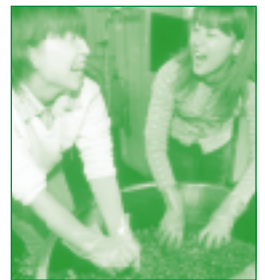
ワイン仕込み体験

丘陵一面に広がるぶどう畑は置賜盆地の夏の風物詩です。そのぶどうを摘みとり、自分の手でつぶして手書きのラベルを貼れば、「私だけ」のオリジナルワインのできあがりです。南陽市の4軒のワイナリーで仕込み体験ができます。ワイン仕込み体験を希望する方は、川西ダリヤ園への入園と農家そばやでのお昼がセットになったバスツアー「おきたま花回廊号」を是非ご利用ください。仕込んだワインは後日のお受取りとなります。