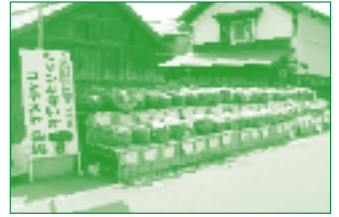
ジャンボすいかコンテスト