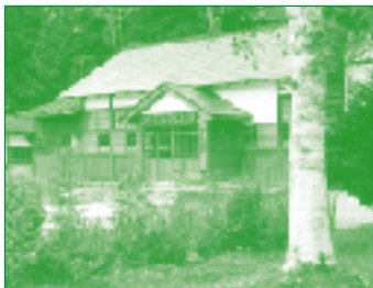
廃校を活用した四季の学校