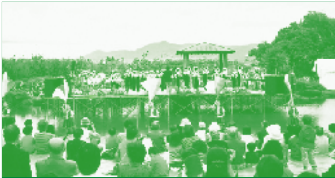
花と緑の調べ「水辺の夜会2002」