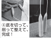
④底を切って、削って整えて、完成!