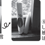
⑥ラッピングして、片方は被災地、片方は自分へ。