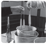
③ピンの口に入る位の太さになったらOK。