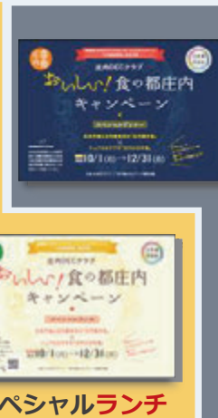
スペシャルディナー