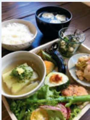
「季節のおまかせ料理」