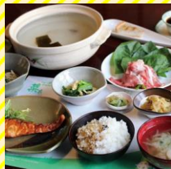
やさいの荘の家庭料理菜あ 庄内エリア（鶴岡市）