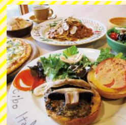
マッシュルームスタンド向形 最上エリア（向形町）