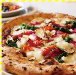
穂波街道 緑のイスキア 庄内エリア（鶴岡市）