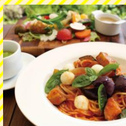
トラットリア・ノンノ 最上エリア（新庄市）