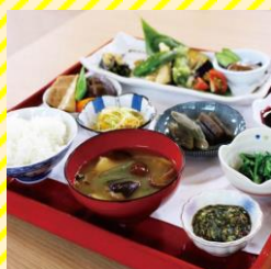
たしろ亭 村山エリア（寒河江市）