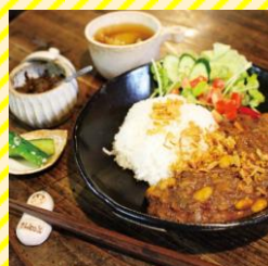
靴屋カフェとKitchen 村山エリア（河北町）