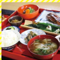
ほっこり処 みなもとや 最上エリア（鮭川村）