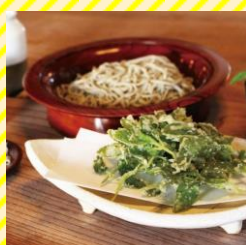
そば吉里吉里 村山エリア（天童市）