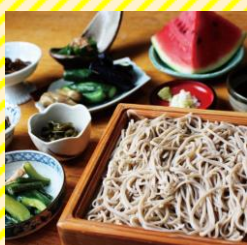
百笑家 姫 村山エリア（尾花沢市）