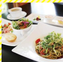
リストラテ 喜右エ門 置賜エリア（米沢市）