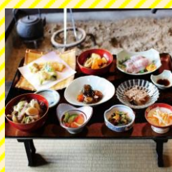
農家茶屋 いろいろ 置賜エリア（飯豊町）