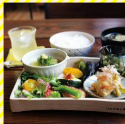
day by day 庄内エリア（酒田市）