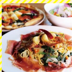
エルバ 置賜エリア（飯豊町）