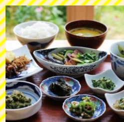
自然・食 浄心庵 村山エリア（東根市）