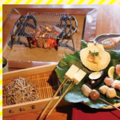
生石 大松屋 庄内エリア（酒田市）