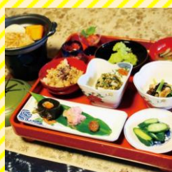
郷土料理 梅ヶ枝清水 村山エリア（東根市）