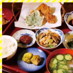
なごみ庵 置賜エリア（長井市）