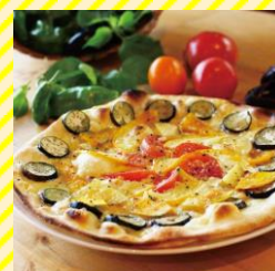
カームヒル 村山エリア（上市市）