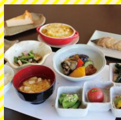
農々家 庄内エリア（庄内町）