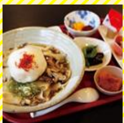
食彩遊膳 まる梅 村山エリア（河北町）