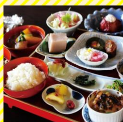
たもやま工房 草木庵 村山エリア（村山市）