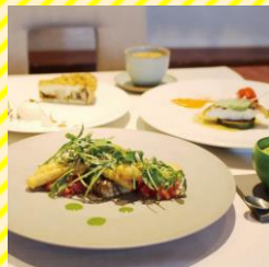
Restaurant Nico 庄内エリア（酒田市）