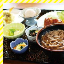
旬彩レストラン あいあい 置賜エリア（小国町）