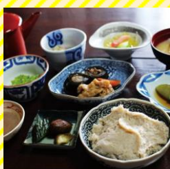
くれない苑 村山エリア（村山市）