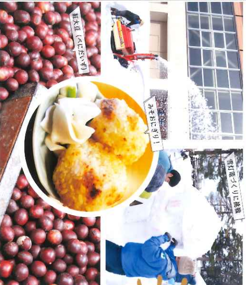
紅大豆「くさいたいず」