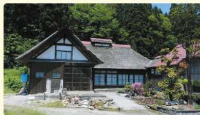
昼食会場: 土礼味噌